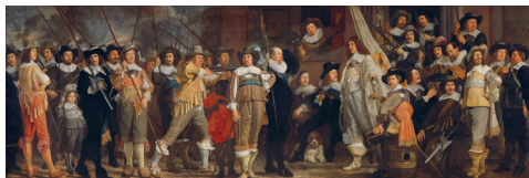
Schuttersstuk van Van der Helst

Bekijk nu een ander schilderij van schutters. De afbeelding vind je achterin deze lesbrief. Welk schilderij vind jij mooier? Waarom zou 'De Nachtwacht' zo beroemd zijn?