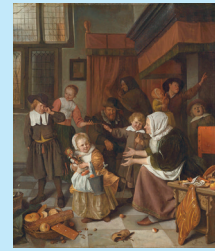
Het Sint-Nicolaasfeest Jan Steen (1626 - 1679)

Jan Steen was een heel bekende schilder. Meestal schilderde hij huizen waarin het een rommeltje was of waarin kinderen kattenkwaad uithaalden. Welke schilderijen zijn van Jan Steen, denk jij?