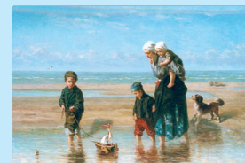
Kinderen der zee, Jozef Israëls (1824-1911)