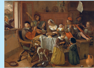
Het vrolijke huisgezin, Jan Steen (1626 - 1679)