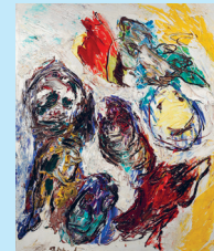
Springend in de lente. Karel Appel (1921-2006)